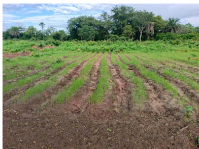
Rijstteelt in het regenseizoen